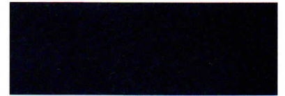
Blackmagic perleffekt* • Z4Z4