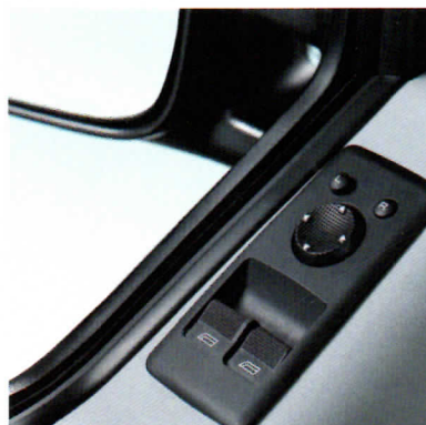
Bedienung für elektrische Fensterheber im Fahrerhaus und elektrische Außenspiegeleinstellung.

Und damit Sie auch auf Ihre Fahrräder nicht verzichten müssen, befindet sich am Heck