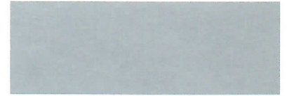
Reflexsilber metallic • 8E