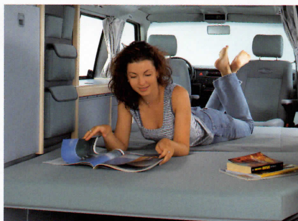
Foto oben: Sitzgruppe mit großem Tisch. Foto unten: Rücksitzbank wird zur geräumigen Liegefläche.

Über die umfangreiche Serienausstattung des California Coach hinaus verfügt der California Generation u. a. über Klimaanlage, Standheizung mit Zeitschaltuhr, beheizbare Vordersitze, Wärmeschutzverglasung im Fahrerhaus und Isolierverglasung im Wohnbereich, Nebelscheinwerfer und Teppicheinlegeböden im Fahrerhaus und Wohnbereich.