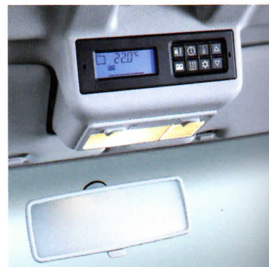
Im Blickfeld angeordnete Zentral-elektronik mit Bedienung für Standheizung und Kühlbox.

des „Generation“ ein Fahrrad-träger, der gleich vier Fahrräder aufnehmen kann, egal ob Kinder-, Tourenräder, Mountainbike oder Trekkingrad.