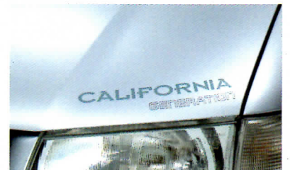
Metall- bzw. Perleffekt-Lackierung, Schriftzug „Generation“.

Ihr Partner für Volkswagen Nutzfahrzeuge