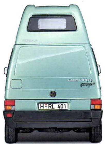
Das Heck des Exclusive aus doppelschaligem GfK, mit 30 mm starker Isolierschicht aus Mineralwolle, mit Serviceklappe und Heckfenster oben.