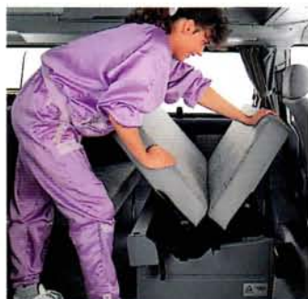
... und dann nur noch die Sitzbank nach dem bewährten Couch-Prinzip auseinanderklappen, ...