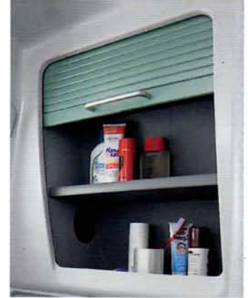
Unten: Der Kleiderschrank enthält Wäschefächer sowie eine herausziehbare Kleiderstange.