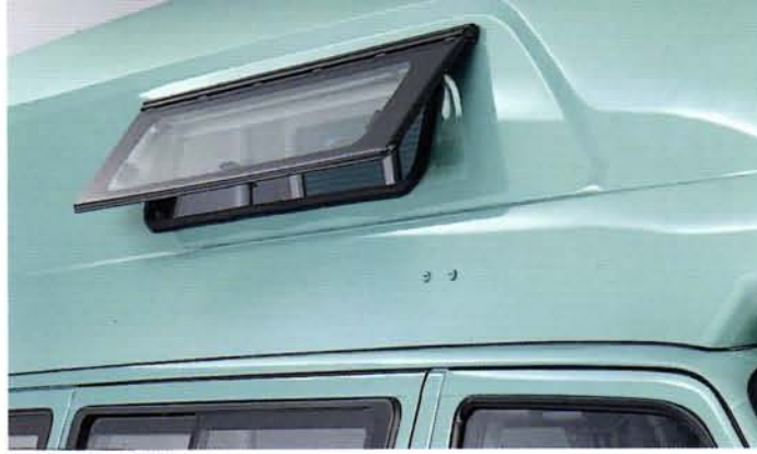
Isolierverglaste Ausstellfenster mit stufenloser Verstellung beidseitig im Hochdach. Jeweils ausgestattet mit Verdunkelungs- und Mückenschutzrollo.