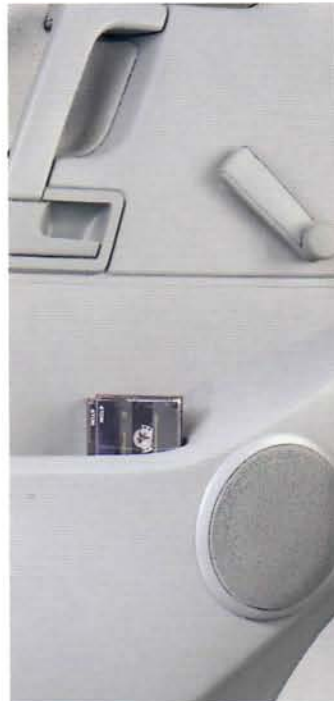
Sechs Lautsprecher sind serienmäßig an Bord; selbst die Antenne in der Frontscheibe gehört dazu.

Kindersicherung an der Schiebetür, die nicht jeder bietet. Oder die getönten Scheiben im Fahrerhaus.