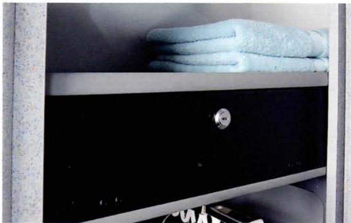
Ein abschließbares Wertfach im Kleiderschrank sichert Geld und Papiere.

Der Sanitärraum des Exclusive ist gleichzeitig auch das Ankleidezimmer, denn gegenüber der Toilette ist der Kleiderschrank plaziert. Der hat es wirklich in sich. Seine Pluspunkte: Herausziehbare Kleiderstange, Wäschefächer, Halterung für den Tisch während der