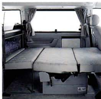
... schon ist die ebene Liegefläche fertig. Das Bettzeug steckt im Fach hinter der Rückenlehne.