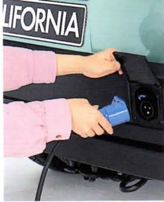
Steckdose im Stoßfänger für den Anschluß an 230-Volt-Netzstrom.