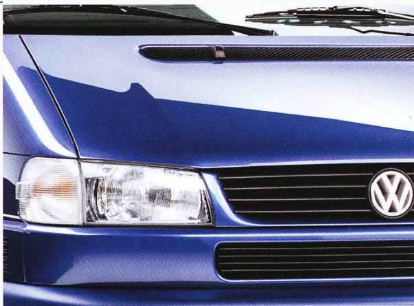
Technoblau metallic • K9

Informationen über Einzelheiten zur Technik, Motorisierungen und zur Serienausstattung des Grundmodells finden Sie im Hauptkatalog California Coach bzw. im Technischen Datenblatt.