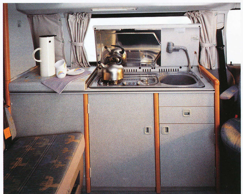
Die Küchenzeile mit zweiflammigen Gaskocher, Spülbecken und geräumigem Unterschrank