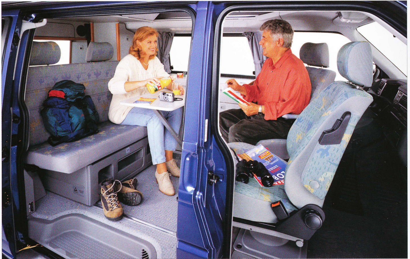
Gemütliche Sitzgruppe mit Sitzbank, gedrehten Fahrer- und Beifahrersitz und großem Tisch