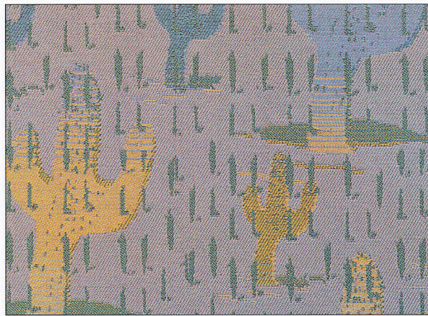
Stoff: Jaquard, Dessin „Kaktus“ • WL