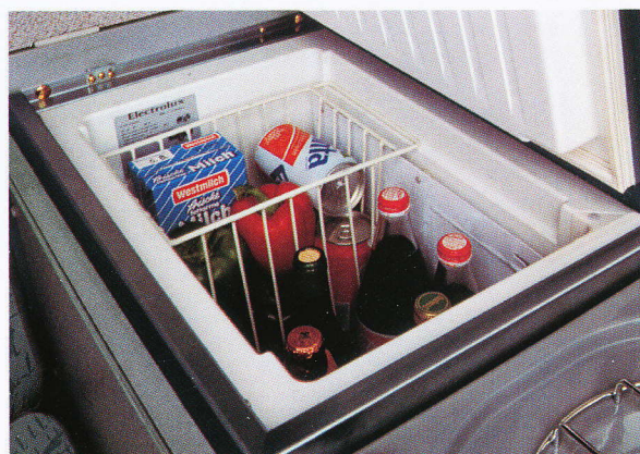
40-Liter-Kompressor-Kühlbox Zusatzausstattung: Tragekorb